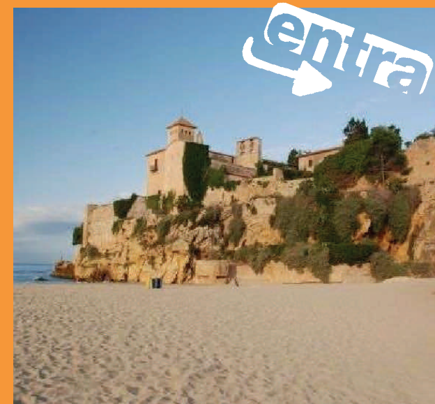
Platja de Tamarit